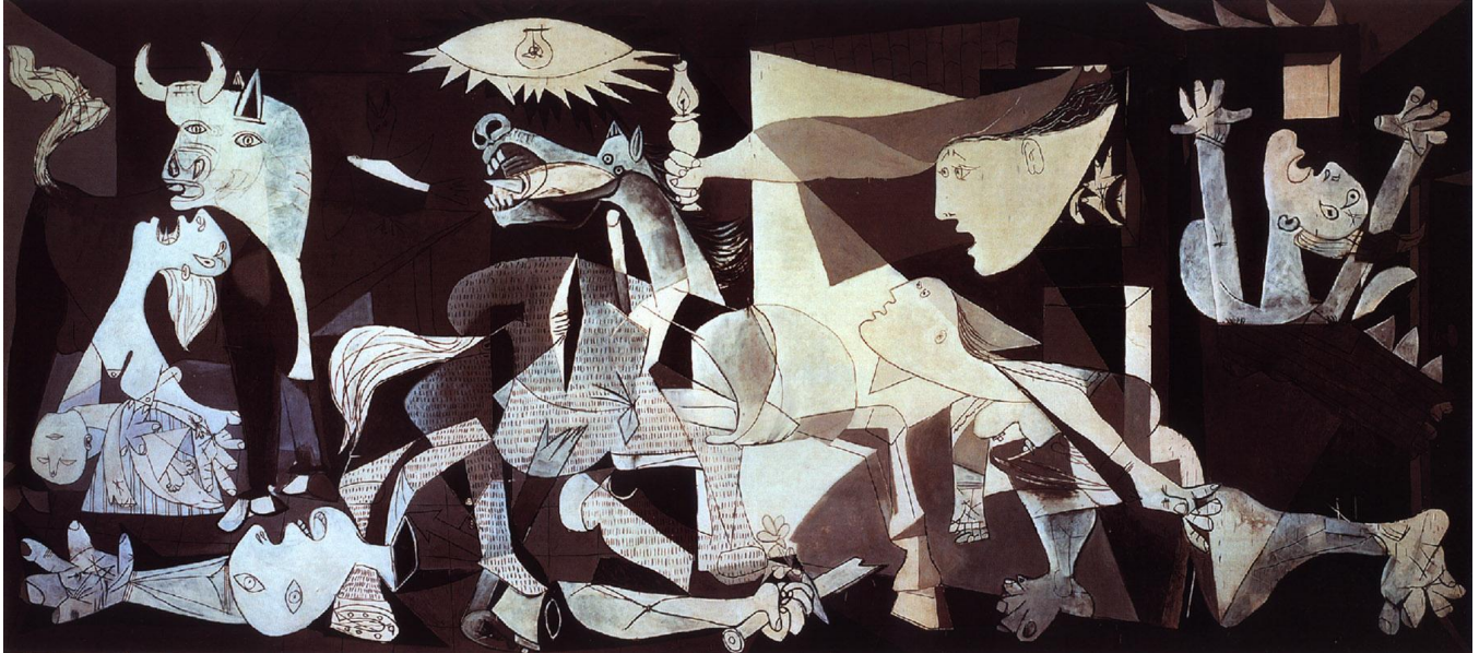
Pablo Picasso, Guernica , 1937

When this painting was made, most people would have been aware that the small Spanish village of Guernica was bombed by Italian and German warplanes. The Pro-Fascist Spanish government believed the village contained anti-Fascist rebels, and asked Italy and Germany to help fight.