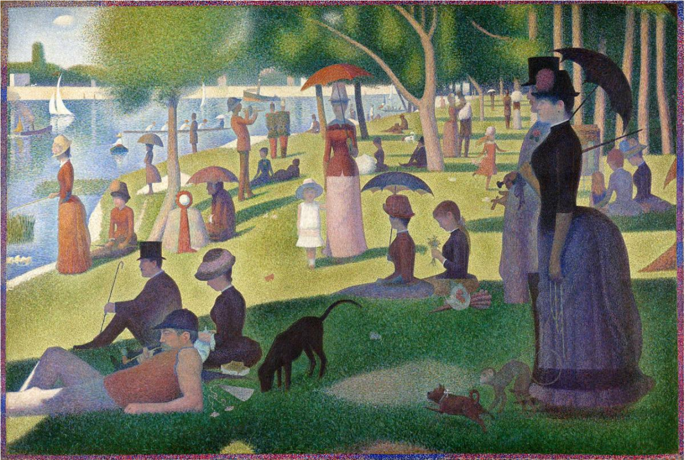
Georges-Pierre Seurat, A Sunday Afternoon on the Island of La Grande Jatte (Një pasdite e së dielës në ishullin La Grande Jatte), 1884–1886.

You are allowed to use phone or computer-based translation for this assignment. If you do, please send the results to your teacher.