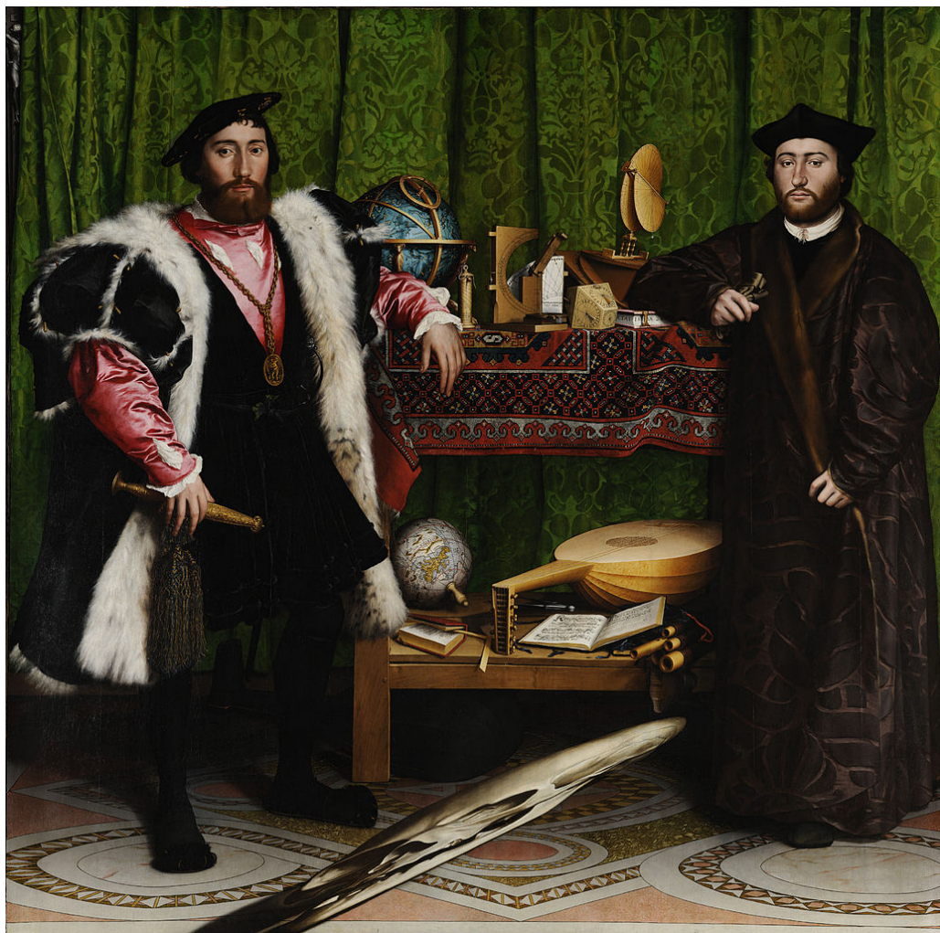
Hans Holbein, The Ambassadors (Ambasadorët) , 1533.

You are allowed to use phone or computer-based translation for this assignment. If you do, please send the results to your teacher.